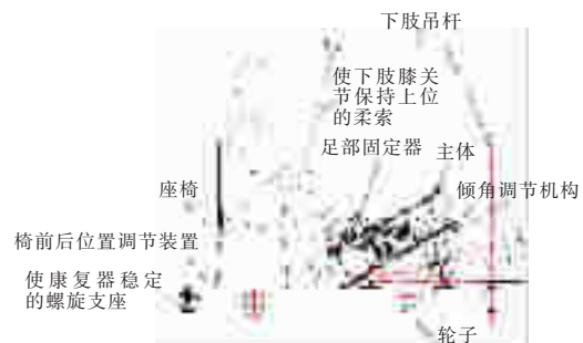
图 3 下肢康复训练器结构简图

下肢康复训练器结构如图 3 所示,训练器中安装有安全保护装置,其中包括:电流过载保护装置,急停按钮。